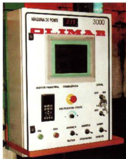
Quadro de Comando