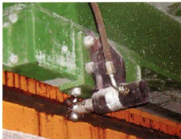
Bloqueio da Ponte quando esta a Cortar