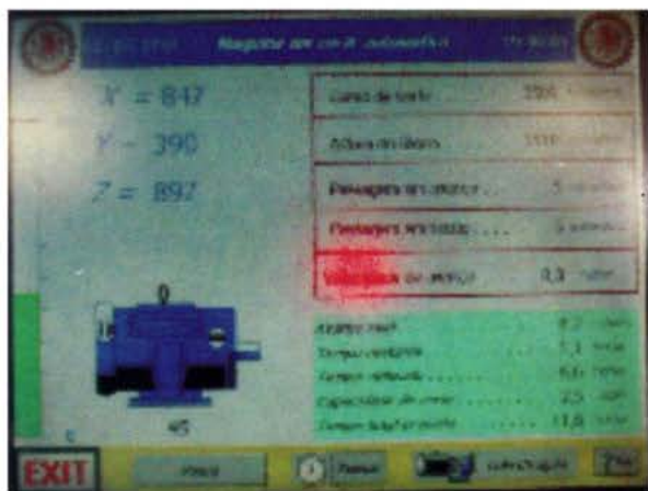
Painel de Comando Táctil